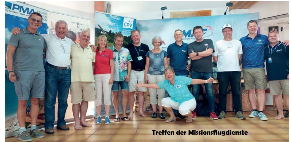
Treffen der Missionsflugdienste