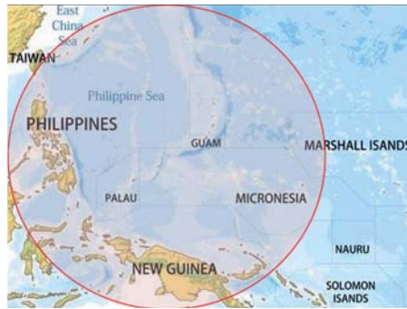
Die Beech King Air hat eine viel höhere Reichweite als unsere jetzigen Maschinen

Die King Air wurde PMA für einen Preis von 1,5 Mio. USD angeboten. Zusätzlich kalkulieren wir noch Kosten von 0,5 Mio. USD für die erste Turbinenwartung, den Erwerb fehlender Sitze, weitere Ersatzteile, sowie Neben- und Überführungskosten ein. Erst wenn eine Finanzierung möglich scheint, würden wir die King Air erwerben. Bisher haben wir bei so einigen Unternehmen, Fördermitteltöpfen und Stiftungen angefragt und warten auf Antworten.