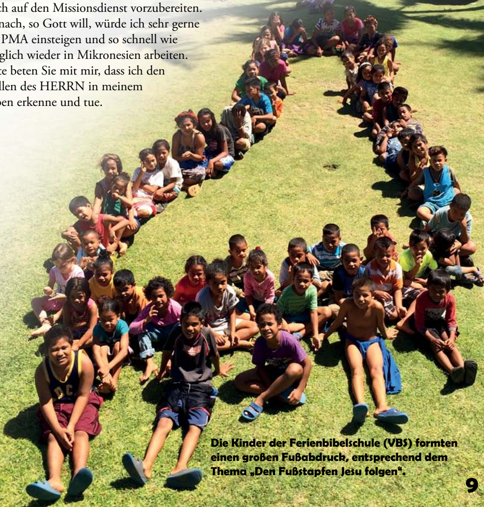
Die Kinder der Ferienbibelschule (VBS) formten einen großen Fußabdruck, entsprechend dem Thema „Den Fußstapfen Jesu folgen“.

Im September beginne ich eine Bibelschulausbildung, um Gottes Wort besser kennen zu lernen und mich auf den Missionsdienst vorzubereiten. Danach, so Gott will, würde ich sehr gerne bei PMA einsteigen und so schnell wie möglich wieder in Mikronesien arbeiten. Bitte beten Sie mit mir, dass ich den Willen des HERRN in meinem Leben erkenne und tue.